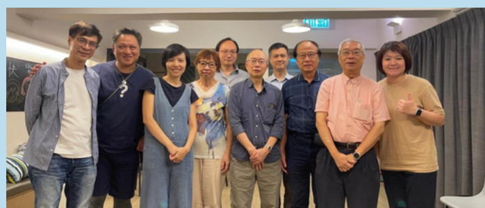
筲箕灣浸信會 執事團隊同行伙伴